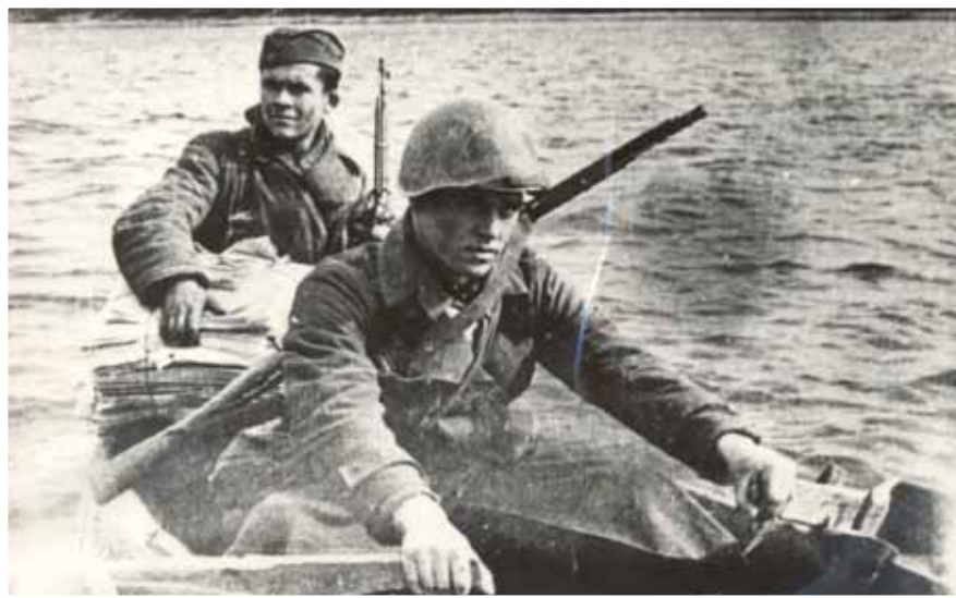
Полевая почта. 1940-е гг.

Вот отрывок из такого письма командирам, комиссарам, политработникам и бойцам 311-й стрелковой дивизии от 14 мая 1942 года: «Здравствуйте, дорогие наши товарищи, боевые друзья–командиры, комиссары, политработники и бойцы 311-й стрелковой дивизии! От имени трудящихся города Кирова